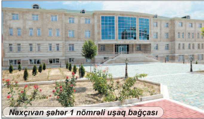
Naxçıvan şəhər 1 nömrəli uşaq bağçası