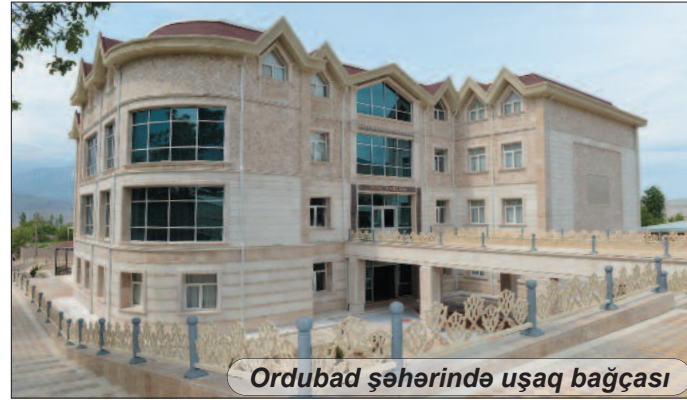
Ordubad şəhərində uşaq bağçası

hazırlayır, rəqslər edirlər. Tərbiyəçilərdən biri bizi uşaqların maraqlı əl işləri ilə tanış etdi. Balacalarımız, həqiqətən də, burada əməksevərliyi öyrənirlər.